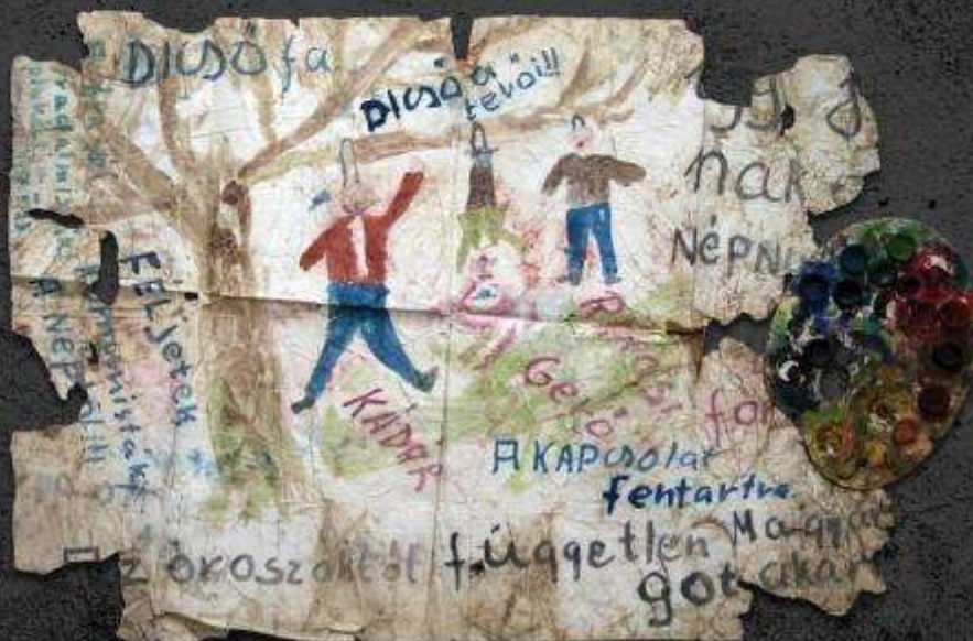
Az író levele: Arany BNL, 1981. XXV. évf. 906. 1997.