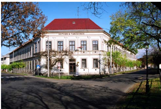
A város második legrégebbi tanintézménye

Hatvanban az első elemi iskola 1878-ban nyitotta meg kapuit, majd 1888-ban elindult a tanoncképzés is. 1893 tavaszától óvoda működött helyben. 1894-ben elkészült a képviselő-testület anyagi hozzájárulásával és a község lakosainak adományaiból a belközségi iskola. A polgári fiúiskolában 1902-ben indult meg a tanítás, majd 1924-ben felső mezőgazdasági iskola, 1927-ben reáliskola nyitotta meg kapuit, amelyet 1931-ben reálgimnáziummá minősítettek.