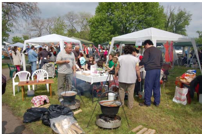
A május 1-i főzőverseny és Civil Sokadalom résztvevői