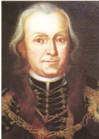
I. Grassalkovich Antal

21 nagy báljemez (öreg) ágyú van, azonkívül 86 darab kisebb nagyobb ágyú, melyek a falakon készen állanak. Másféle hadiszereinek se szeri se száma. ...A külváros keleti részén... egy dombon, mintegy ezer szőlőskert díszlik... vize és levegője igen kellemes. A belső várrészen 500 szűk ház van fából építve zsindelytetővel, a külvárost palánk veszi körül lőrészekkel. E városrészben 200 deszkaépítésű ház látható, szegényeké...” Hatvan hadászati majd kereskedelmi jelentőségét jól mutatja, hogy a XVI-XVIII. század időszakában számtalan korabeli metszeten örökítették meg a települést.