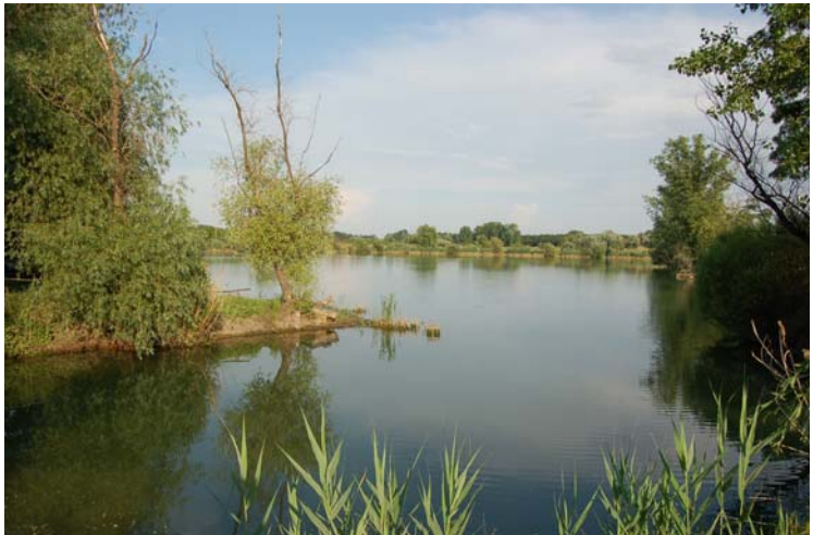
A város határában található sóderbánya tavak egyike

A Zagyva folyó melletti Szúnyog szigetén működik a Hatvani Vadaspark, ahol kulturált környezetben kisebb haszon- és vadonélő állatokat tekinthet meg a látogató. Európai Unió forrásból elkészült a Zagyva balparti gátján egy kerékpár-út, amelyen egyik irányba Apcig, míg a másik irányban a Jászságig lehet eljutni.