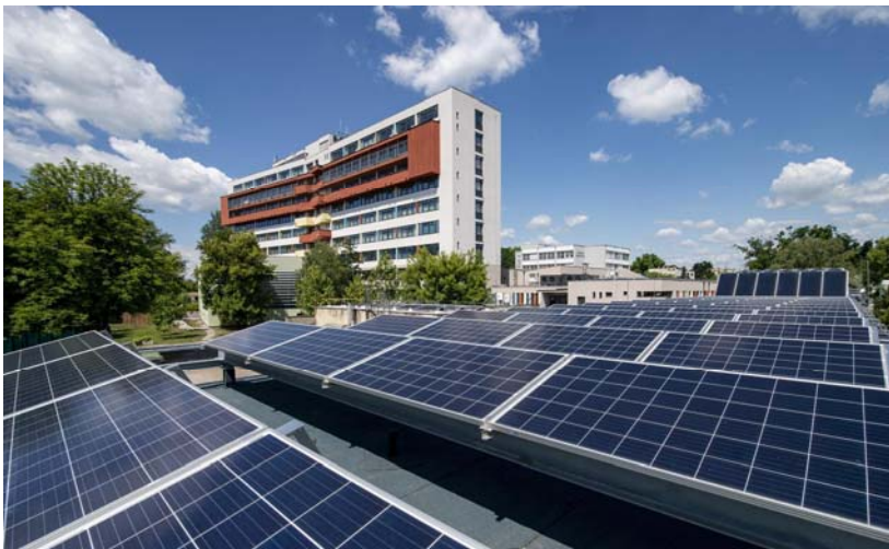
Az Albert Schweitzer Kórház működését segíti a napelemparkja

A Szociális, Gyermekjóléti és Egészségügyi Szolgálat mint a nevében is benne van igen fontos alapfeladatokat lát el. Az intézmény legfőbb célja, hogy megakadályozza a perifériára szorulást, illetve a szociális helyzetük, életkoruk, fogyatékoságuk miatt peremhelyzetbe került embereket visszasegítse a társadalomba. A rászoruló személy a saját lakókörnyezetében