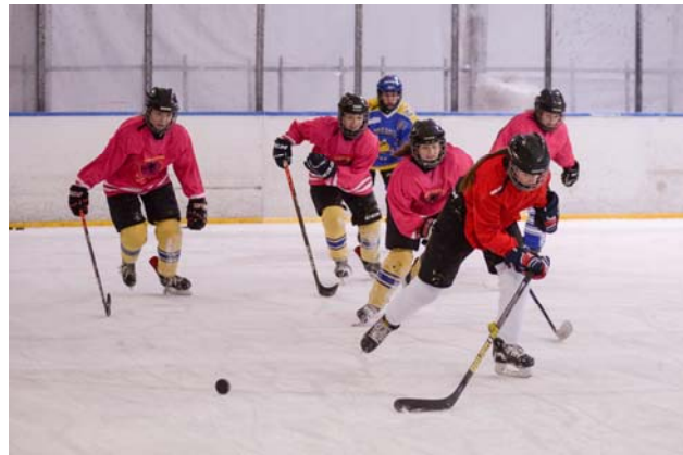
A Hatvani Gigászok edzése a jégpályájukon

szociális ellátása megoldott. Egy kórház, egy szakorvosi rendelőintézet jelenti a szakmai háttérrel, míg az alapellátást tíz házi orvos és négy házi gyermekorvos végzi. Emellett hat fogorvos tevékenykedik, akik TB támogatással, illetve magánpraxissal rendelkeznek. Hatvanban jelenleg hat patika látja el gyógyszerrel a betegeket. 2003. június 20-án adták át azt a dialízis központot, ahol a térség veseelégtelenségben szenvedő betegei rendszeres kezelést kaphatnak. Az Albert Schweitzer Kórház épületét néhány éve újították fel, korszerű műszerezettségét tekintve megfelelő módon szolgálja a térség lakosainak legkorszerűbb egészségügyi ellátását.