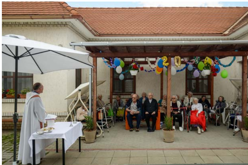
A Szent Erzsébet otthon alapításának 20. évfordulóját ünneplik az intézmény lakói

Helyben található még a Szent Erzsébetről elnevezett Idősek Otthona, mely egyházi irányítással működik, jelenleg 20 időskorú befogadására alkalmas. A bentlakásos intézményben folyó gondozási tevékenység során az intézmény szolgáltatását igénybe vevők részére, fizikai, mentális, életvezetési, és egészségügyi ellátást nyújtanak, amely a lakó szociális, testi, szellemi állapotának megfelelő egyéni