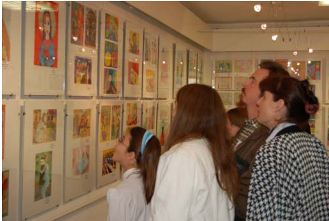
A Hatvani Galéria egyik nagyszerű tárlata, amely a helyi általános iskolások rajzait mutatta be

A Hatvani Galériát Moldvay Győző újságíró alapította 1973-ban, és igazgatóként a realista stílusú művészeti irányvonalat képviselte a hely. 1974-ben a Magyar Tájak Országos Tájképfestészeti Biennálé, majd egy évre rá, az Arcok és Sorsok Portré Biennálé kapott komoly szakmai visszhangot. Mára évenkénti rendszerességükkel ezek a kiállítás sorozatok a hazai művészeti élet reprezentatív megmértetései. Moldvay 1996-os halála után az intézményben tovább folyik a szakmai munka, és az alapító által bejártatott kiállítássorozatok mellett újabbak is meghonosodtak azóta.