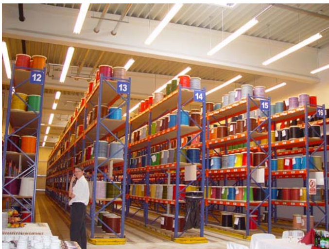
A Leoni AG. kábelraktára

A német Leoni vállalatcsoport 1998-ban 6,2 millió eurós beruházással építette meg hatvani gyárat, ahol napjainkban közel 200 dolgozó foglalkozik a szigetelt autóvillamossági kábelek gyártásával, melyek a fő autógyártó cégek, mint az Audi, Volkswagen, BMW, Mercedes, General Motors és a Ford gyárakban készülő autók elektromos vezérlésének a gyártócsarnokot adtak át, amelyben újabb gépeket telepítettek.