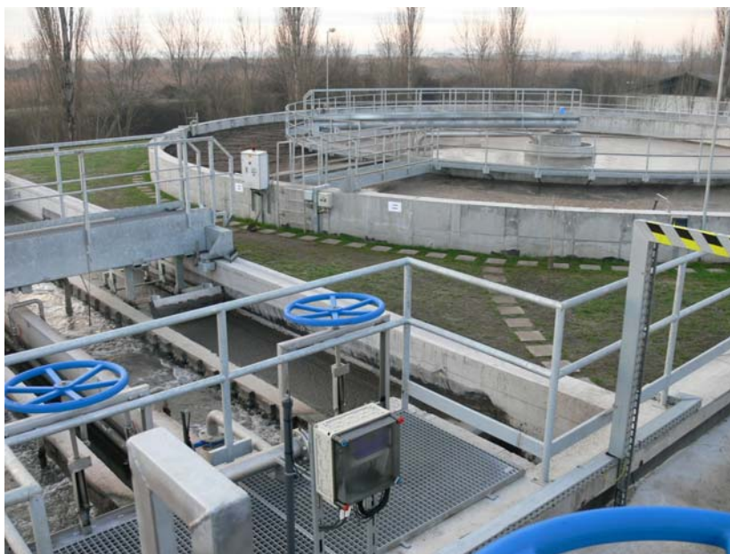
A 2007-ben átadott szennyvíztisztító telep a város határában