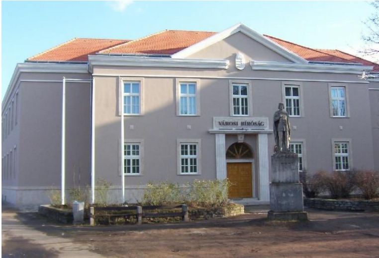
A 2004-ben felújított épület, immár sátortetős kivitelben, előtte Szent Imre szobra áll