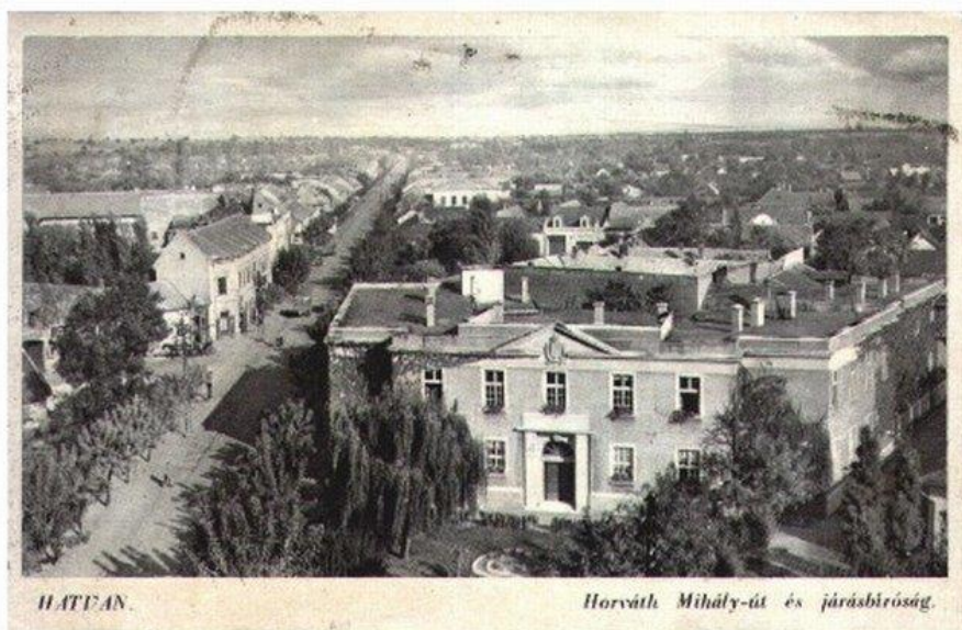
A Hatvani Jársi Bíróság épülete a templomtoronyból fotózva