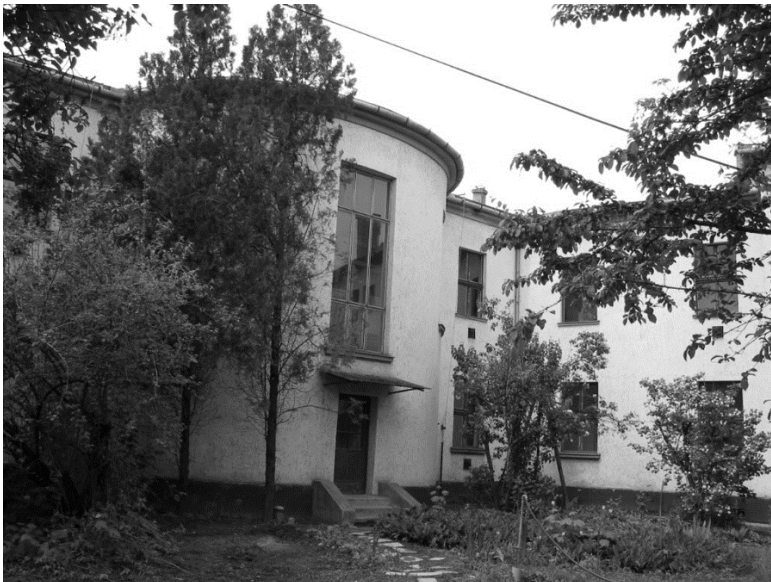
A bíróság udvari része

Nagyobb felújítás 1989-ben történt az épületen. Majd 2004-re igen rossz állapotba került megint, és az országban működő 154 bírósági épület közül ez is a felújítandók listájára került. 2004. év májusában elkezdték az épület rekonstrukcióját. Ennek keretében megszüntették az addig az épületben lévő főbírói lakást, illetve egy látványos átalakításra is sor került, az eredetileg lapostetős épületre 2004-ben sátortető került. A teljeskörű felújítás és átépítés után 2005. február 1-én újfent megnyithatta kapuit. 2013. január 1-től a bíróság neve újra Hatvani Járásbíróság lett.