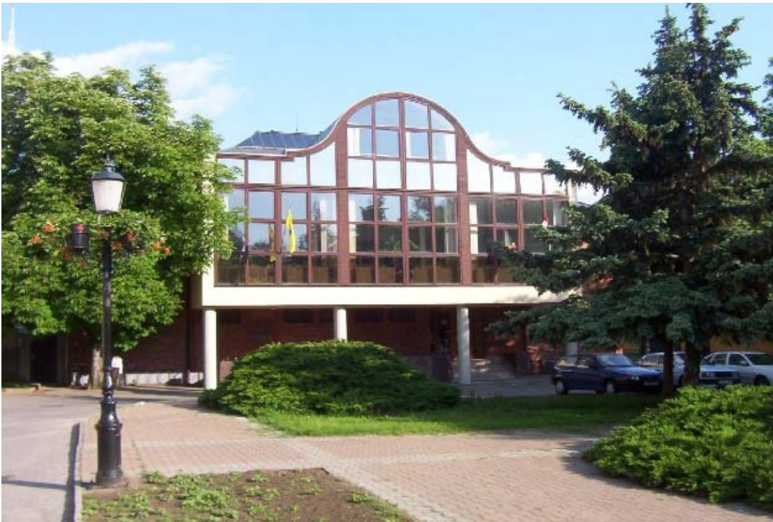
A bibliotéka épületének 1993-2019. közötti homlokzata