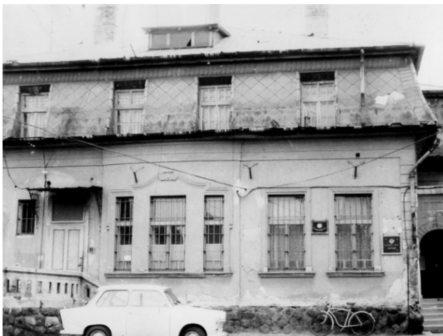
Az egykori Tömegszervezeti Székház

A Magyar Szocialista Munkáspárt (röviden: MSZMP) marxista–leninista párt volt Magyarországon, amely a Szovjetunió támogatásával és felügyeletével egypártrendszer keretében, állampártként gyakorolta kizárólagosan a hatalmat 1956. novembere és 1989. októbere között. Az állampárt 1956. decemberétől elkezdte kiépíteni a saját szervezeti kereteit. Hasonlóan a közigazgatási rendszerhez, országos, megyei, járási, városi pártbizottságok alakultak. A Hatvanban létrehozott járási szervezet először az ún. tömegszervezeti székházban működött, ami a Horváth Mihály úton, az egykori Ring-féle házban volt. A hajdani villaszerű épületbe volt bezúfolva a Vöröskereszt, a Nótanács, az MHSZ, a KISZ, a Munkásőrség, a helyi Rádiós klub és a gyermekkönyvtár is.